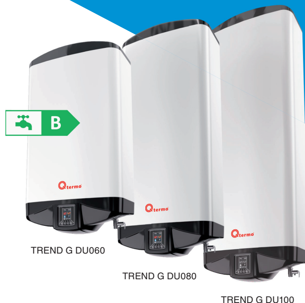
TREND G DU060