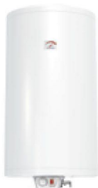
TREND 150 - 200 L