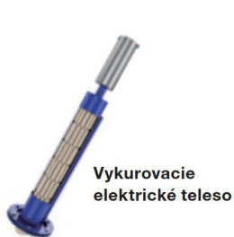
Vykurovacie elektrické teleso