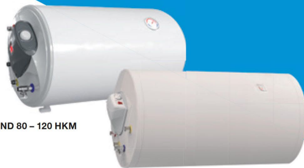
TREND 80 – 120 HKM

Kombinovaný ohrievač vody určený pre horizontálnu inštaláciu – objem 80/120/150/200 litrov – štandardný ohrev