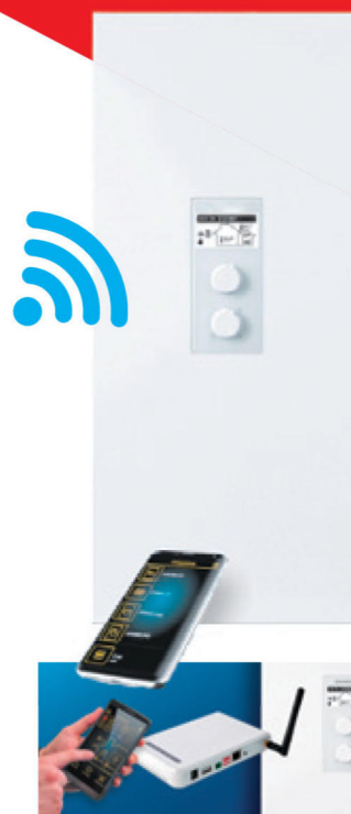
prídavný modul C.MI 2